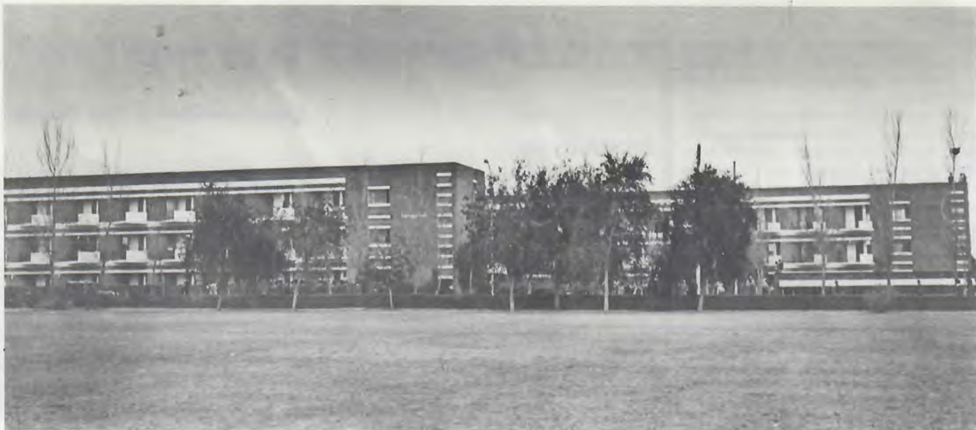
Chandigarh, Le Corbusiers skapelse i nordindien, byggdes 1951.