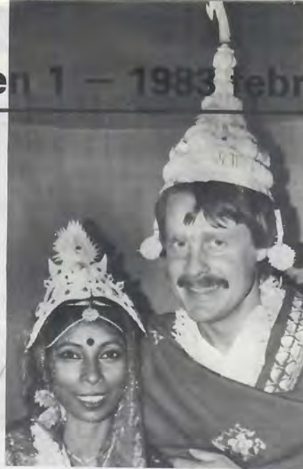
Sydasiensbulletinen: redaktören tar sin uppgift på allvar.

Vad ska han då säga när han upptäcker hur det står till med Televerket?