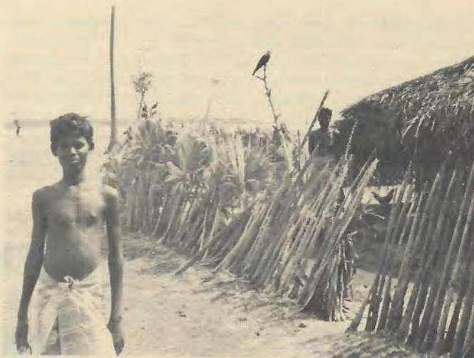
Invånaren på landsbygden i Sri Lanka är en av dem som slutgiltigt får betala i utsugningens kedja från periferin (u-världens landsbygd och fabriks-golv) till centrum (direktionsrummen i de imperialistiska bolagen i USA och Europa). Han har redan inlett sina krav på rättvisa...

Situationen för fru Bandaranaike var nu allvarlig, inte minst med tanke på de kommande valen som enligt författningen ska hållas i maj. I tidigare val har det visat sig viktigt för SLFP att ha den reformistiska vänsterns (CP och LSSP) stöd så en definitiv brytning nu skulle komma olägligt. Inte minst med tanke på att det konservativa UNP vunnit många fyllnadsval sen 1970.