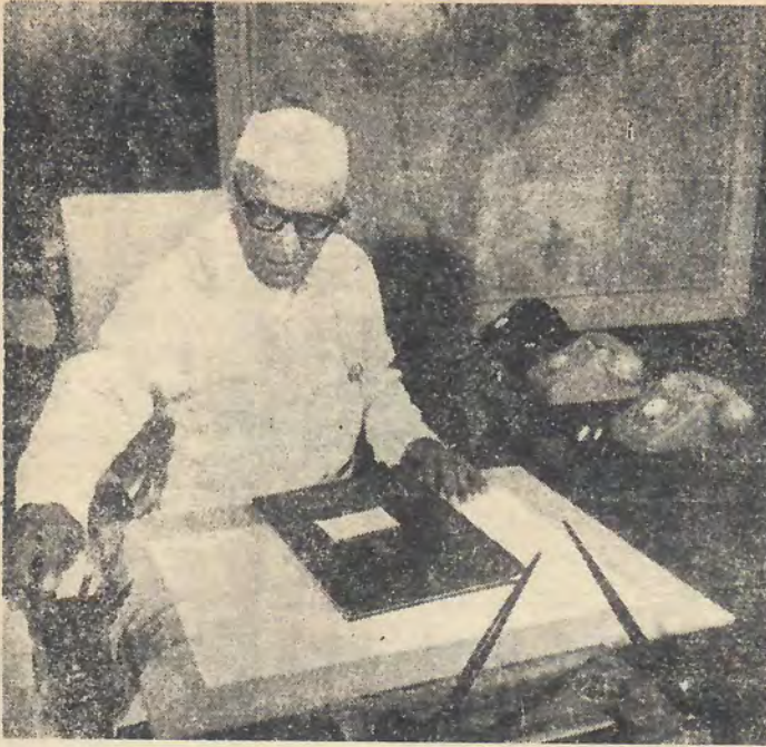
Indiens nye premiärminister, Mr Morarji Desai, har lovat att avskaffa fattigdomen på 10 år.

Den här våren har för Sydasiens del, speciellt Indien, Pakistan och Sri Lanka, varit behäftad med valfusk, strejker och polisbrutalitet. De val som hållits i Indien och Pakistan, och som i maj skall hållas i Sri Lanka, kräver en närmare analys.