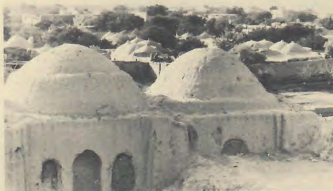
Lerhus med kupoler från trakten av Balkh i norra Afghanistan.

Den ekonomiska strukturen i stort ser, fortfarande, ut som en triangel. Dess hörn utgörs av irrigationsjordbruket, boskapsnomadismen och basarernas hantverk och handel. Marknadsplatserna förbinds med grusvägar trafikerade av lastbilar, kameler och åsnor. Det finns en genomgående asfaltväg med avstickare upp till ryska gränsen. Det finns ingen järnväg. Det finns nästan ingen industri.