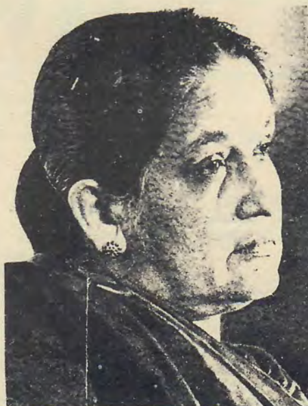
Mrs Bandaranaike, Sri Lankas premiärminister.

Det är dock knappast troligt att fru Bandaranaike kunnat köpa sig fri med detta. I raden av impopulära inrikespolitiska åtgärder har nu regeringen dessutom stängt parlamentet från den 10:e