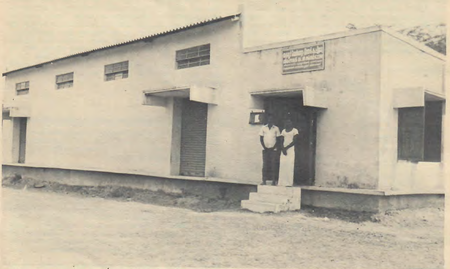
Bakom 20-punktsprogrammets stolta fasad var det ganska tomt, precis som i kooperativets lagerbyggnad i Thaiyur, som i januari -77 innehöll en säck konstgödning.

Kampen mot ockrarna verkade framgångsrik så länge man höll sig i städerna: pantlånarnas butiker hade stängts eller förvandlats till vanliga affärer. Men på landet fanns de kvar. De opererade kanske mera försiktigt, men det drabbade mest låntagarna: det blev svårare att få lån; panterna värderades lägre, betalningsvillkoren skärptes.