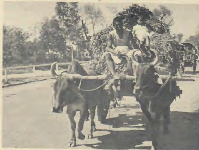
Oxspann på Gulbarg Road i Lahores utkanter.

Valresultatet berodde på valfusk, tillkännagav oppositionen. Den reste krav på Bhuttos avgång, tillsättande av en expeditionminister och nyval under militär kontroll. PNA vägrade inta de 36 platser man vunnit i parlamentet, utlyste generalstrejk och vägrade delta i valen i de fyra provinserna, val som skulle hållas ett par dagar senare. I Karachi, oppositionens högborg, och på många andra platser väckte anmaningarna till generalstrejk anklag, trots att regeringen några timmar efter valet återinfört undantagstillstånd. Oppositionens anhängare attackerade fordon och kommunikationsmedel; när järnvägsräls började rivas upp på Karachis bangård inskred utposterade trupper. Oroligheter utbröt även på andra håll. I Rawalpindi kostade strider mellan rivaliserande partier dödsoffer.