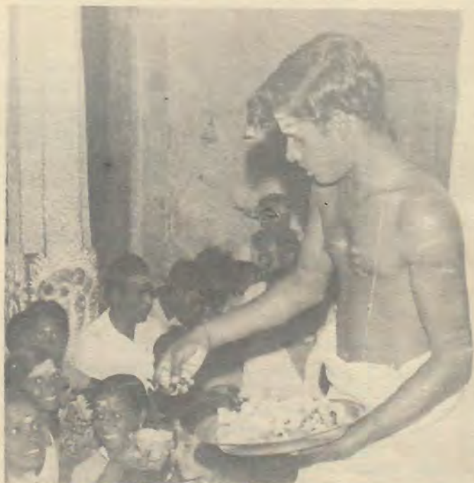
20-punktsprogrammets propagandaeffekt byggde på utdelning av favörer till befolkningen (lån, tomter etc.), d v s samma mekanism som vid denna sötsaksutdelning under Pongalhögstiden.

I det nordindiska bältet var mass-steriliseringen mest intensiv; och denna kampanj är ett uttryck (men det viktigaste) för de diktatoriska metoderna inom Kongresspartiet (och kanske också i administrationen). I en rapport citeras en Kongressmedlem av delstatsparlamentet i Uttar Pradesh: Vid ett tillfälle befann han sig på resa i sin egen valkrets och blev vittne till hur polisen släpade bort en fattigbonde för sterilisering. Eftersom han var väl känd för poliserna frågade han: »Vad gör ni?» »Det har ni inte med att göra», blev svaret. Kongressmannen blev alltså förolämpad inför ögonen på sina valmän av ett par vanliga polis-konstaplar på ett sätt som tidigare varit helt otänkbart. Detta illustrerar, inte bara varför gensvaret på jordbruksminister Jagjivam Rams avhopp från Kongressen blev ganska stort, utan också varför partiets valkampanj blev så lam, och till vissa delar passivt motarbetades av de egna partiarbetarna.